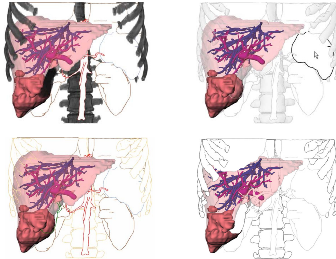
Abb. 2. Auswahl von Visualisierungen, die mit dem System erzeugt wurden. In allen Fällen befindet sich die Leber mit einem Tumor im Fokus und verwendet Oberflächenvisualisierung. Fokusnahe und Kontextobjekte werden mit Hilfe verschiedener Kombinationen von teilweise farbigen Linien, Oberflächenvisualisierung und direktem Volumen-Rendering dargestellt.

Die Definition von Standardwerten für die Darstellung von Organen, Gefäßen, Knochen und Tumoren basiert auf dieser Befragung. Dabei hat sich gezeigt, dass Silhouettenlinien, die sich in ihrer Darstellung nicht an die Tiefe anpassen, als flach empfunden werden und daher als alleinige Rendering-Technik ungünstig sind. Die Kombination von stark transparenten (beleuchteten) Oberflächen mit Silhouetten ist günstig für größere Objekte, die den Kontext darstellen (Organe, Knochen). Die Darstellung von Fokusobjekten kann verbessert werden, wenn die Merkmalslinien ebenfalls dargestellt werden (Abb. 3).